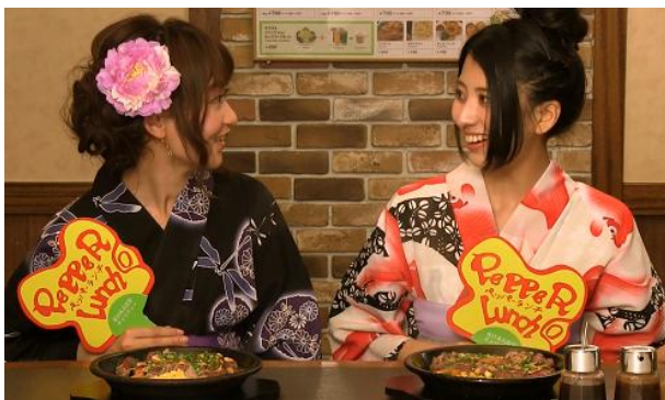
③ ガーリックワイルド登場！