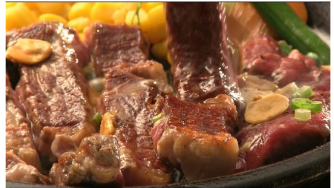
④ ジュージュー焼いて～