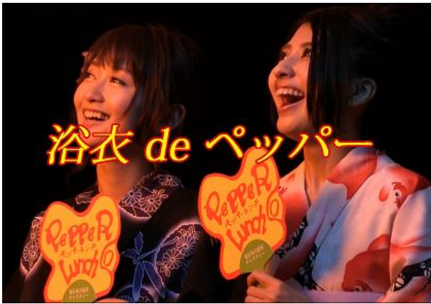
① 花火を觀賞する浴衣女子