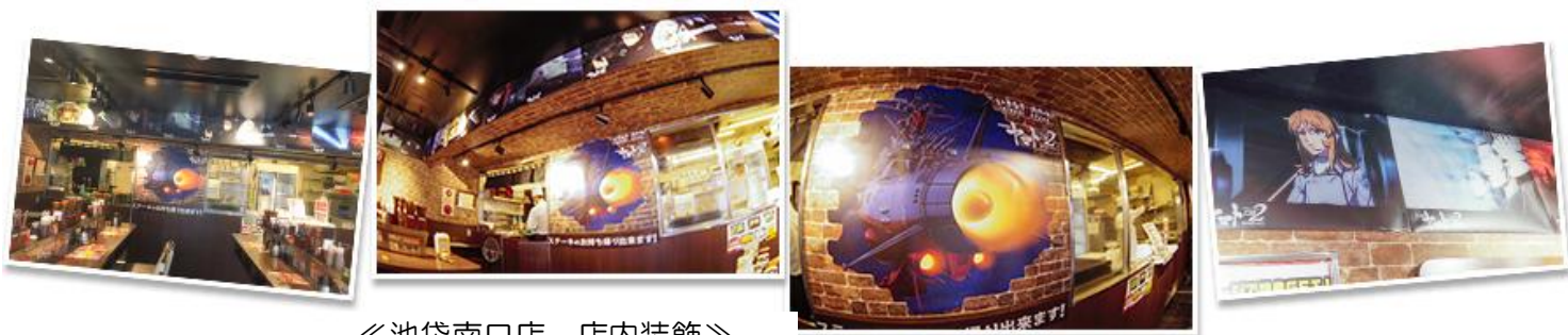
《池袋南口店 店内装飾》

「いきなり!ステーキ池袋南口店」限定で、店内を『宇宙戦艦ヤマト 2202 愛の戦士たち』の名場面を表現しています。